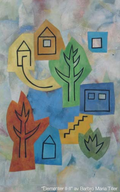
"Elementer II-II" av Barbro Maria Tiller